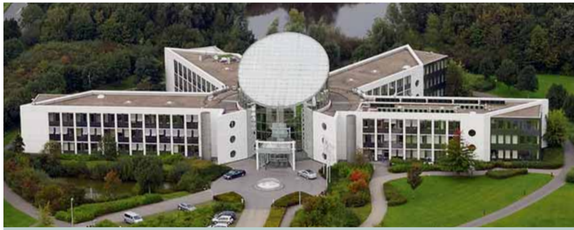
Ihren Stammsitz hat die GEA Group in Bochum. Das weltweit tätige Maschinenbauunternehmen beschäftigt 20.000 Mitarbeiter.

Kunden der GEA ihre Projekte umsetzen wollen, auf der ganzen Welt verstreut. Das gilt sowohl für die etablierten Märkte der westlichen Welt, als auch für die aufstrebenden Wachstumsmärkte wie Brasilien oder auch Asien. Um dort ein Projekt planen und umsetzen zu können, kommt man trotz der heutigen medialen Welt um Lokaltermine für detaillierte Planungen bzw. notwendige Montagearbeiten nicht herum. Daher müssen die Projektplaner und Ingenieure des Unternehmens – nicht zuletzt wegen der immer stärkeren Verteilung der Projekte – auch immer mobiler werden. Im Endeffekt bedeutet das, dass aufgrund der internationalen Ausrichtung der GEA Dienstreisen mit dem Flugzeug ein unverzichtbares Mittel sind, um er-