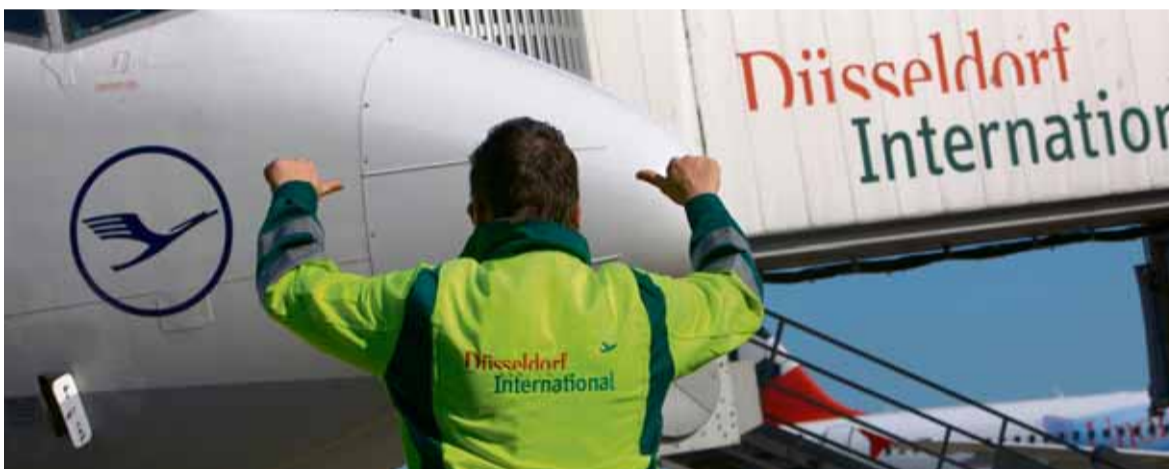
Von den 16.422 Menschen, die am Airport arbeiten, sind rund 14.650 bei Firmen beschäftigt, die ihren Sitz am Flughafen haben. Hinzu kommen etwa 1.100 Arbeitsplätze in der Airport City.

Davon sind nach einer aktuellen Arbeitsstättenenerhebung 16.422 Arbeitnehmer beispielsweise bei Luftverkehrsgesellschaften, Speditionen und Luftfrachtunternehmern, Caterern, Vertretern der Hotellerie, Gastronomie und des Einzelhandels, Reisebüros, Autovermietern, Mineralölkonzernen, Behörden wie bei der Bundespolizei sowie bei der Flughafengesellschaft und ihren Töchtern tätig. Rund 1.100 Mitarbeiter haben darüber hinaus bereits ihre Heimat bei 25 Unternehmen im Businesspark „Airport City“ direkt am Flughafen gefunden. „Als größte Arbeitsstätte der nordrhein-westfälischen Landeshauptstadt gibt der Düsseldorfer Flughafen somit auch in schwierigeren wirtschaftlichen Zeiten erhebliche Beschäftigungsimpulse für ganz NRW, eine der wirtschaftsstärksten Regionen Europas“, betont Christoph Blume, Sprecher der Flughafen-geschäftsführung.