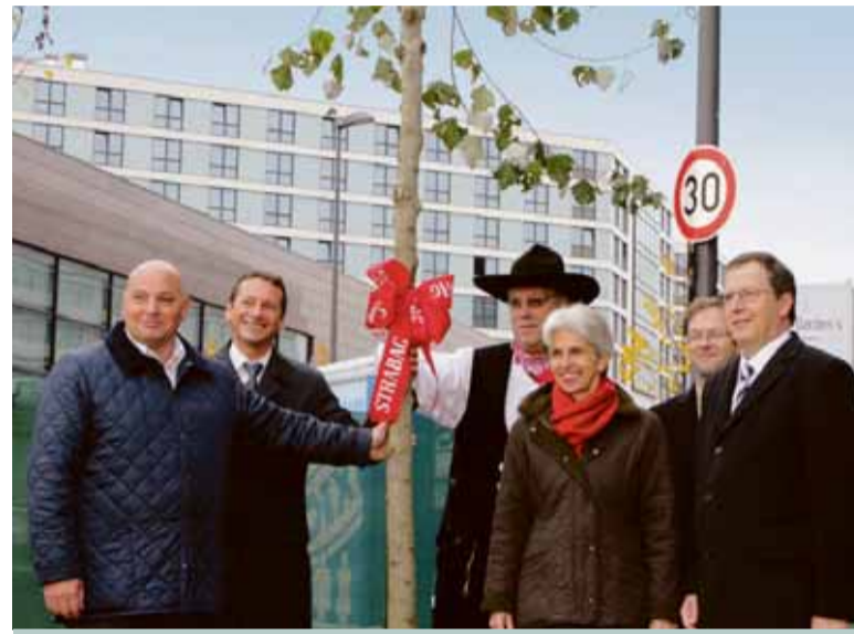
Ende Oktober wurde am Airport das Richtfest für das Bürogebäude „Airport Garden's“ gefeiert.

Der Rohbau steht! Ende Oktober feierte die STRABAG Real Estate GmbH das Richtfest für das sechsgeschossige Bürogebäude namens „Airport Garden's“ in der Düsseldorf Airport City. Nach gutem Brauch lobte der Bauherr ausdrücklich die hervorragende Arbeit aller am Bau Beteiligten. Denn dank der guten Arbeit der Planer und Handwerker konnte bereits nur sieben Monate nach der Grundsteinlegung das Richtfest gefeiert werden. Im Sommer 2010 soll das Gebäude fertiggestellt sein.