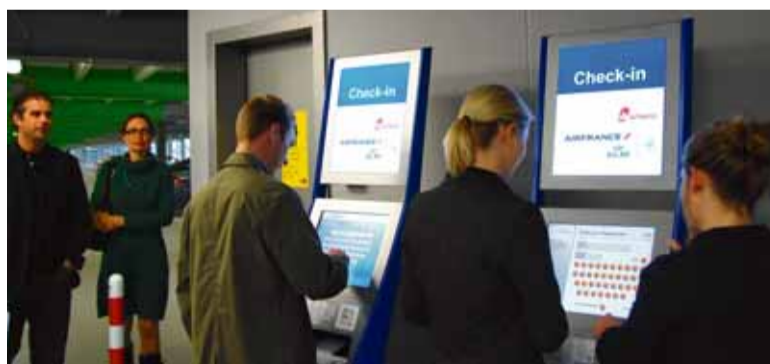
Am Düsseldorfer Flughafen gibt es insgesamt 15 neue Check-in-Automaten, an denen Passagiere selbstständig einchecken können.

Insgesamt können die Passagiere an 15 neuen Automaten einchecken. Sechs davon befinden sich auf der Abflugebene des Terminals nahe der Flughafeninformation. Acht Geräte wurden in den Parkhäusern 2, 3, 7 und 8 installiert. Ein weiteres Gerät wird derzeit in der BMW-Niederlas-