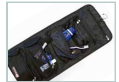
Für die Reise: Kulturtasche/schwarz 9 Euro

Ein passendes Geschenk – nicht nur für Flughafenfans – ist das silberfarbene Lineal mit kleinem Flieger. Das „Flugzeug auf der Startbahn“ besteht aus veredeltem, matt gebürstetem Metall. Es ist dekorativ auf jedem Schreibtisch und garantiert eine perfekte Punkt-zu-Punkt-Verbindung. Verkauft wird es in einer schwarzen Verpackung. Länge/Breite: 200 m/30 mm