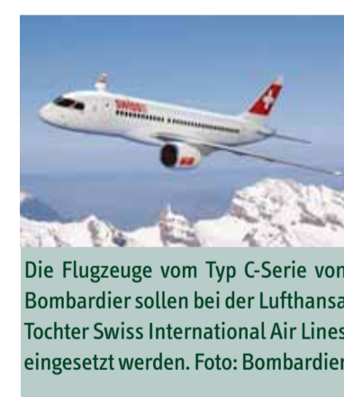
Die Flugzeuge vom Typ C-Serie von Bombardier sollen bei der Lufthansa Tochter Swiss International Air Lines eingesetzt werden.

LFT wird im Rahmen der Vereinbarung Piloten und Kabinenbesatzungen für in Europa beheimatete Betreiber der 110-sitzigen CS100 und der 130-sitzigen CS300 ausbilden, während LTT das technische Training übernimmt. Kunden von LFT und LTT können dazu deren bestehendes Netzwerk von Ausbildungszentren an verschiedenen Standorten in Europa nutzen. Bei ihrer Einfüh-