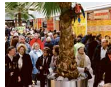
Anfang des Jahres kamen fast 100.000 Besucher zum ReiseSuperMarkt.

Seit sechs Jahren veranstaltet der Flughafen den großen ReiseSuperMarkt im mehrfach ausgezeichneten Termi-