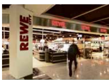
Seit November können Gäste und Passagiere des Flughafens im neuen Rewe-Markt täglich von 5 bis 24 Uhr einkaufen.

REWE eröffnete im November den zweiten REWE City-Markt in einem deutschen Flughafen. Der 660 Quadratmeter große Markt bietet im Ankunftsbereich C täglich von 5 bis 24 Uhr ein umfassendes Angebot an frischen Lebensmitteln und Artikeln des täglichen Bedarfs wie Obst und Gemüse, frische Backwaren, Säfte, Wurst, Käse, Feinkost und Wein bis hin zu Kosmetik und Tiernahrung.