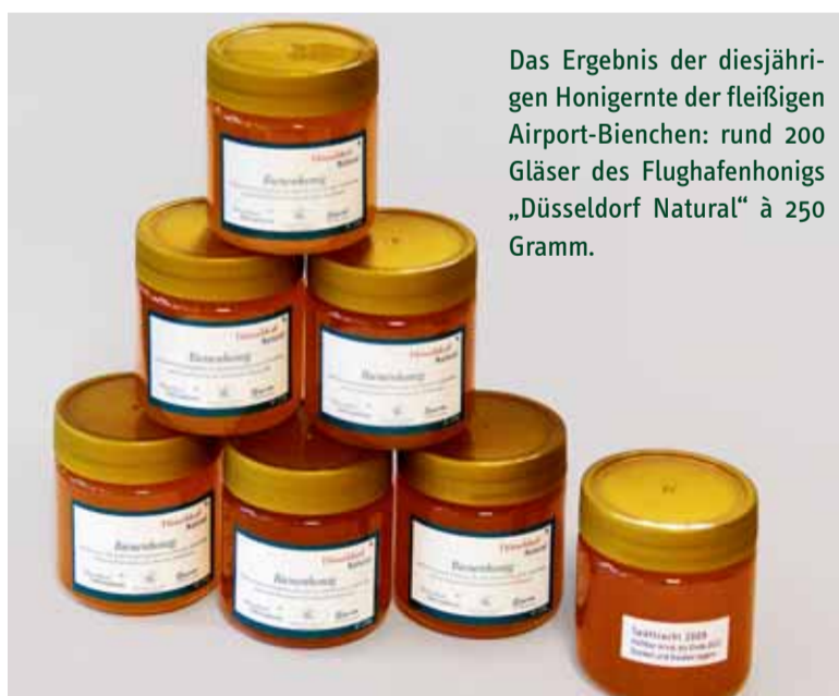
Das Ergebnis der diesjährigen Honigernte der fleißigen Airport-Bienen: rund 200 Gläser des Flughafenhonigs „Düsseldorf Natural“ à 250 Gramm.

Da Bienen Schadstoffe zum einen direkt über das Wasser oder die Luft, zum anderen indirekt über die Pollen und den Nektar von Pflanzen aufnehmen, lassen Bienen und Honig Rückschlüsse darüber zu, ob der Flugverkehr möglicherweise Auswirkungen auf die Flora rund um den Flughafen hat. Wie immer wurde auch die diesjährige Ernte des Airport-Honigs doppelt analysiert. Sowohl bei der Untersuchung auf Schadstoffe wie Schwermetalle und polyzyklische Koh-