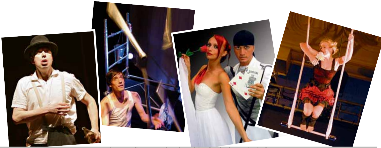
Vorhang auf! Internationales Zirkusfestival am Flughafen