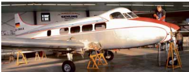
Nach und nach sah die Dove einem „fertigen“ Flugzeug immer ähnlicher. Hier hatte der Oldie schon Tragflächen, Fahrwerk und eine fast vollständige Lackierung.