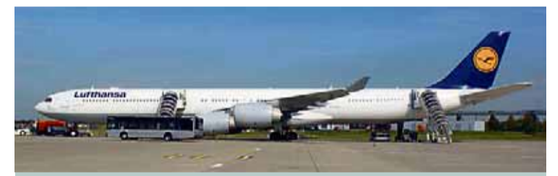
War zu Gast in Düsseldorf: der Airbus A340-600, das längste Passagierflugzeug der Welt.

Er misst vom Bug bis zum Heck stolze 75,30 Meter – und ist somit mehr als zwei Meter länger als der A380: der Airbus A340-600, das derzeit längste Passagierflugzeug der Welt.