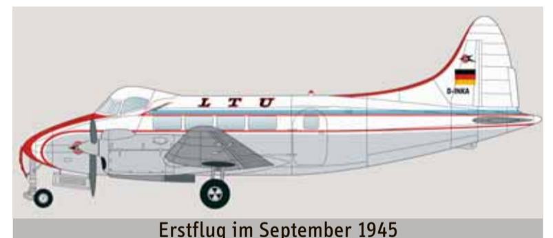
Erstflug im September 1945

VonHierAus-Leser haben darüber hinaus die Möglichkeit, beim aktuellen VonHierAus-Preisrätsel einen Rundflug für zwei Personen mit der historischen De Havilland Dove zu gewinnen. Das Preisrätsel finden Sie auf Seite 5