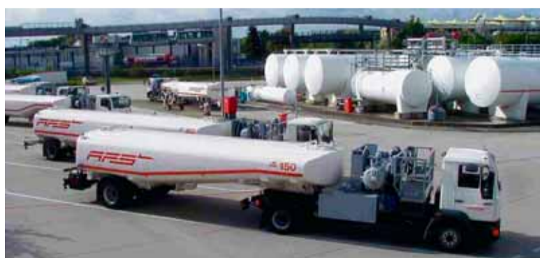
Das Flughafentanklager hat ein Fassungsvermögen von 1,8 Millionen Litern. Die Fahrzeugflotte der Tankfirma AFS besteht aus 135 Flugfeldtankwagen.

Das Flughafentanklager – 1989 fertiggestellt und von der AFS GmbH, Hamburg, konzipiert und erbaut – besteht aus zwei Tankgruppen und hat ein Fassungsvermögen von 1,8 Mil-