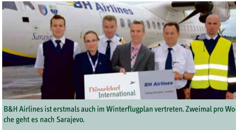
B&H Airlines ist erstmals auch im Winterflugplan vertreten. Zweimal pro Woche geht es nach Sarajevo.

Anfang November begrüßte Düsseldorf International easyJet als neue Fluggesellschaft. Die Airline begann ihr Engagement an NRWs größtem Airport mit einer Verbindung nach Basel und fliegt ab Februar 2010 zusätzlich nach London Gatwick und Rom Fiumicino. Nach Basel fliegt easyJet zwölfmal in der Woche. Die Maschinen vom Typ Airbus A319 starten in Düsseldorf jeweils an den Tagesrandzeiten – montags bis freitags um 8.45 und 21.20 Uhr, samstags um 13 Uhr sowie sonntags um 21.20 Uhr. Die Flugzeit beträgt etwa eine Stunde und zwanzig Minuten. Am 2. Februar nimmt easyJet die Flüge nach Gatwick auf: montags bis freitags um 16.45 Uhr, samstags um 14.55 Uhr, sonntags um