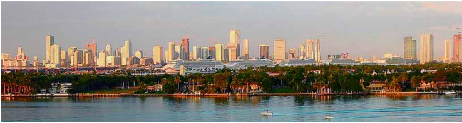
Wie in einer anderen Welt: Little Havana, Everglades und Florida Keys