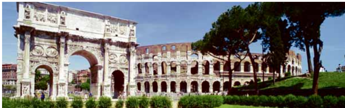
Rom bietet viele Sehenswürdigkeiten und lohnenswerte Ziele. Weltbekannt: das Kolosseum

Rom gehört zu den mit Abstand beliebtesten Zielen für Städte-Reisen in Europa. Keine andere europäische Stadt bietet den Touristen, die aus aller Welt an den Tiber reisen, so viele historische Stätten, wunderbare Kirchen und Museen. Nicht zu vergessen die berühmte italienische Küche, die man in zahlreichen gemütlichen Trattorien und Restaurants der Stadt genießen kann.