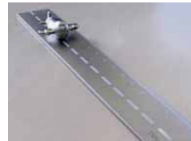
Punkt-zu-Punkt: Lineal mit Flieger 15 Euro

Ein passendes Geschenk – nicht nur für Flughafenfans – ist das silberfarbene Lineal mit kleinem Flieger. Das „Flugzeug auf der Startbahn“ besteht aus veredeltem, matt gebürstetem Metall. Es ist dekorativ auf jedem Schreibtisch und garantiert eine perfekte Punkt-zu-Punkt-Verbindung. Verkauft wird es in einer schwarzen Verpackung. Länge/Breite: 200 m/30 mm