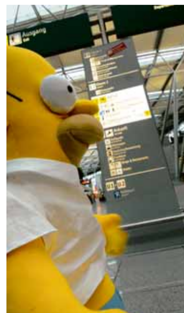
Beliebter Promi am Airport: Homer Simpson

In den kommenden Jahren sollen weitere Flughafenshops von United Labels auf allen europäischen Großflughäfen folgen: Zum Beispiel in Hamburg oder im Frühjahr 2010 in Malaga.