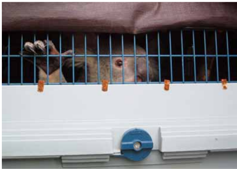
Air Berlin führt Kooperation mit Zoo Duisburg fort

Momentan wandert er um etwa 40 Kilometer pro Jahr in Richtung Nordwesten durch den Norden Kanadas. Die Wanderung des magnetischen Pols ist also dafür verantwortlich, dass die zur Bezeichnung von Start- und Landebahnen herangezogenen Gradzahlen angepasst werden müssen. So hieß die Hauptstart- und -landebahn am Düsseldorfer Flughafen bis November 1988 noch 06R/24L.